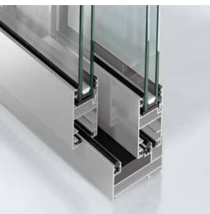
Schüco ASS 32 SC.NI Schüco ASS 32 SC.NI