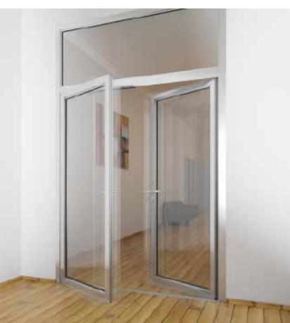
Gegentakttür Opposed opening door

The door and wall construction for multi-purpose applications. The series has been tested in accordance with European standards (EN 1364/1634) and German standards (DIN 4102) and meets the requirements of fire protection classes EI30 (T/F30) and EW30 (G30)