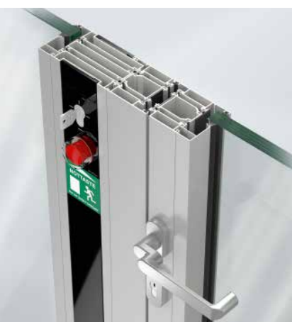
Schüco Door Control System (DCS) Schüco Door Control System (DCS)

The series is based on stable 5-chamber hollow profiles with a basic depth of 80 mm with which clear openings of up to 1,400 mm x 2,988 mm can be constructed. Optional fittings components can be added to create multi-purpose doors to meet the widest range of requirements for building safety, security and automation. In addition to fire and smoke protection properties, this series also has other potential applications. For example, burglar resistance up to RC3 (WK3), a combination of burglar resistance to RC2 (WK2) and panic function, to sound reduction (42 dB) and building authority-approved safety barrier loading suitable for fixed glazing. The use of centre glazing and angled glazing beads offers the user numerous design options. In addition, concealed top door closers/pre-selectors or door hinges can also be used. Fixed glazing may feature as storey-height glazing and can be constructed with vertical silicone joints. The use of an opposed opening door provides a further option. Whether it is in a newbuild or a renovation project, this type of opening allows for trouble-free everyday use.