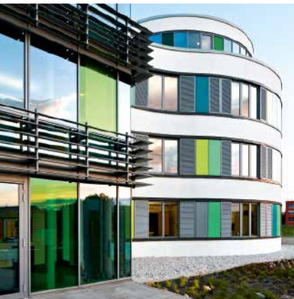
Schüco Aluminium-Türsystem ADS 70.HI Schüco Aluminium door system ADS 70.HI

Aluminium-Türsystem Aluminium Door System