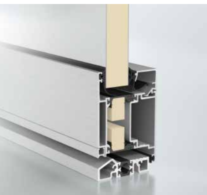
Schüco Tür ADS 70.HI Schüco door ADS 70.HI