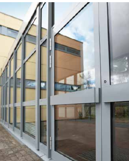
Schüco Aluminium-Türsystem ADS 50.NI Schüco Aluminium door system ADS 50.NI