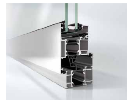
Schüco Fenster AWS 60, nach außen öffnend Schüco Window AWS 60, outward-opening