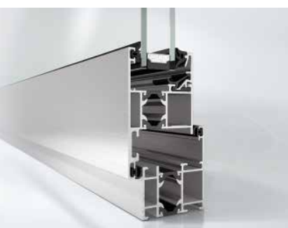
Schüco Fenster AWS 50, nach außen öffnend Schüco Window AWS 50, outward-opening