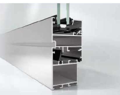
Schüco Fenster AWS 50.NI Schüco Window AWS 50.NI

Schüco Fenster bieten für jeden Markt die richtige Kombination aus Wärmedämmung und geprüfter Systemtechnik.