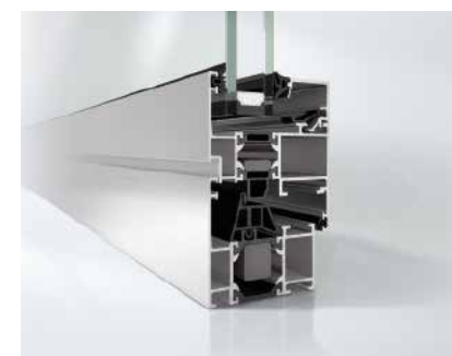
Schüco Fenster AWS 60 Schüco Window AWS 60