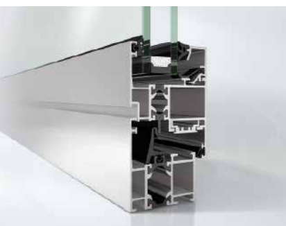
Schüco Fenster AWS 50 Schüco Window AWS 50