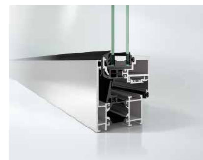
Schüco Fenster AWS 60 BS Schüco Window AWS 60 BS

Schüco hat mit der Fenstergeneration AWS (Aluminium Window System) ein System für alle Anforderungen geschaffen. Funktionale Vorteile verbinden sich mit architektonischen und gestalterischen Aspekten. Vorzüge wie gute Wärmedämmung vereinen sich mit geringen Bautiefen und schlanken Ansichtsbreiten.