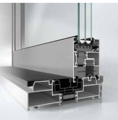
Schüco Hebe-Schiebesystem ASS 70.HI Schüco lift-and-slide system ASS 70.HI